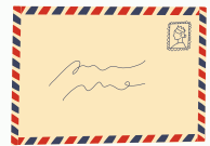
TABLE RONDE "VOYAGE ET ILLUSTRATION"

INSTALLEZ-VOUS TRANQUILLEMENT, ÉVADEZ-VOUS EN AFRIQUE OU AU PROCHE-ORIENT..., ÉCOUTEZ UN EXTRAIT DE RÉCIT DE VOYAGE OU DE CONTE, SANS QUITTER VOTRE SALON.